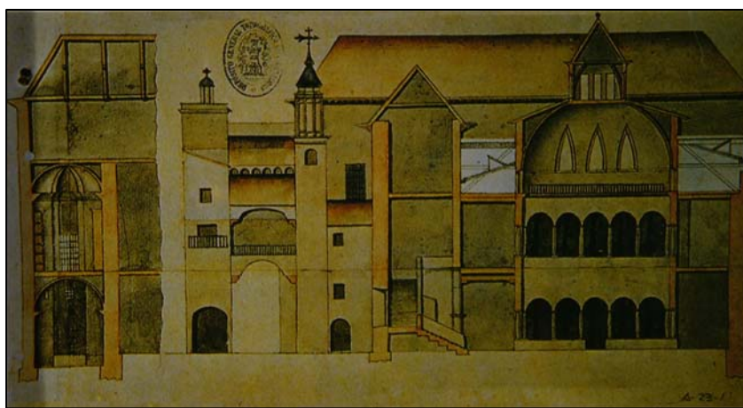
Edificio de la Audiencia, antes Casas del Reino. 1756. Servicio Histórico Militar. Madrid

Alicia Sánchez Lecha Archivo Diputación Provincial de Zaragoza