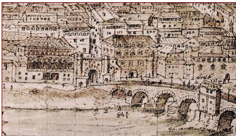
Vista de Zaragoza de Anthonius van den Wyngaerde (1563) Detalle de las Casas del Reino

En el mismo tribunal tuvieron su origen 51 procesos “de denuncia” o “de inquisición de oficiales”, que se hallaron mezclados con los