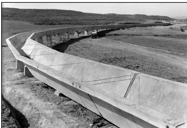
Acequia de Santa Quiteria a su paso por la finca de D. Salvador Ena. San Jorge, zona de Almodóvar (Huesca).

Desde esta Delegación, el INC actuó en las zonas de La Violada (Huesca-Zaragoza), Monegros-Flumen y Cinca (Huesca), Valmuel y Singra (Teruel), Sobradriel, La Joyosa y Marlofa, Civán y Almonacid (Zaragoza), Bardenas (Zaragoza-Navarra), Canal de Lodosa (Navarra, Zaragoza y Logroño), Delta del Ebro (Tarragona), Canal de Aragón y Cataluña (Lérida) y Vencillón (Huesca).