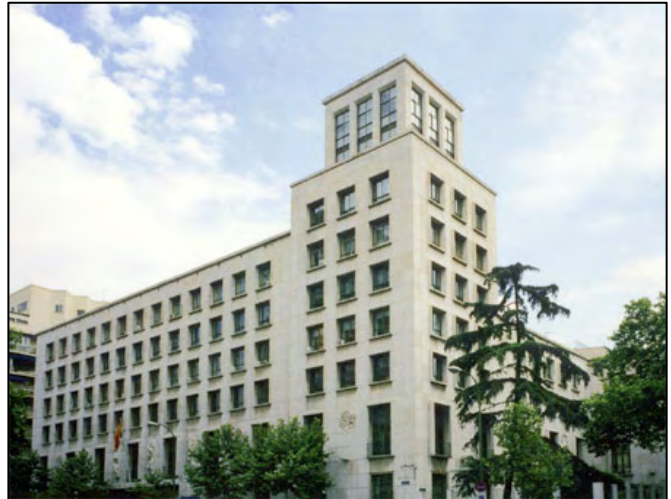
Edificio de la antigua sede central del Instituto Nacional de Colonización, en el paseo de la Castellana (Madrid).

El desarrollo de este proceso se convertirá en el eje propagandístico de la política agraria franquista. Su objetivo principal era la modernización agrícola a través de la transformación del regadío, pero la falta de apoyo por parte de la iniciativa privada ralentizará los efectos de esta Ley de 1939 en las tareas de colonización.