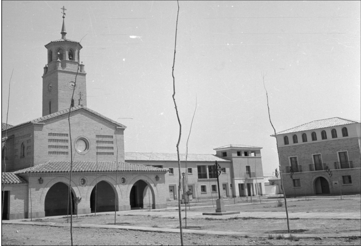
Plaza de El Temple , durante su construcción por el INC.

Colonización es un término de resonancias épicas adoptado por el régimen de Franco para denominar un instituto autónomo, de temprana creación (octubre de 1939) al que se encomendó una reforma de las estructuras agrarias capaz de contrarrestar los efectos de la Ley agraria de 1932. Un organismo que hiciera posible acometer la nueva política hidráulica, que reclamaba sus orígenes en el Regeneracionismo, y la puesta en cultivo y el asentamiento de nuevos pobladores en determinadas zonas de España, todo ello con el dirigismo económico y social característico de la Dictadura.