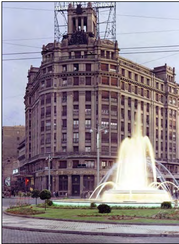
Edificio de la antigua sede de la Delegación Regional del Ebro del Instituto Nacional de Colonización, paseo de Sagasta nº 2.

Esta Delegación, compuesta por un gran número de personas a su servicio, destacó sobre todo por el carácter de su plantilla y su cercanía con las gentes del campo. Asimismo, se distinguió por su disponibilidad y trabajo incondicional por sacar