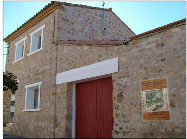
Centro de Interpretación de la Colonización Agraria en España, Sodeto (Huesca).

En él se describe, a través de diferentes salas, el proceso llevado a cabo por el INC en nuestro país. La primera muestra el contexto y la actuación del Instituto en España; la segunda sala se centra de manera más específica en las tareas llevadas a cabo en la región aragonesa, todo ello acompañado por maquetas y paneles explicativos. Cierra esta segunda sala la recopilación de una serie de vídeos y documentos sonoros que recogen los testimonios de diferentes colonos, familiares de los mismos o funcionarios del INC a lo largo de toda la geografía aragonesa. Seguidamente, la tercera sala muestra las principales transfor-