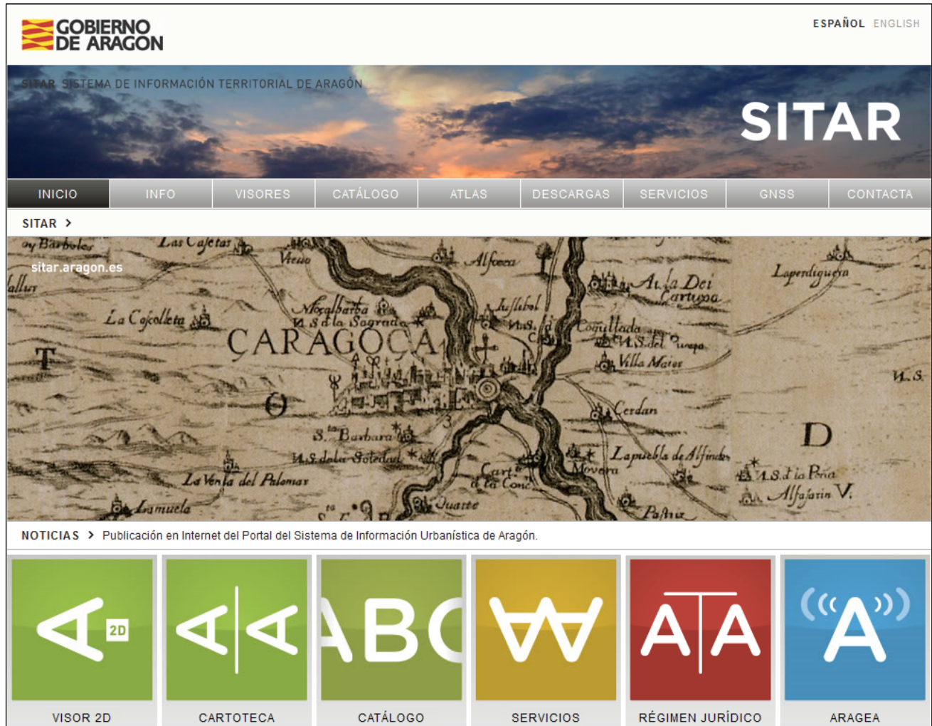
Sitio web del Sistema de Información Territorial de Aragón ( www.sitar.aragon.es )

y la Universidad que trabajan en ello garantizará la eficacia de futuros desarrollos. Es la filosofía general de DARA: intentar que el esfuerzo de